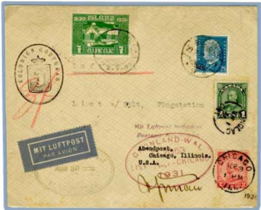
Wolfgang von Gronau auf Westkurs via Grönland 1931